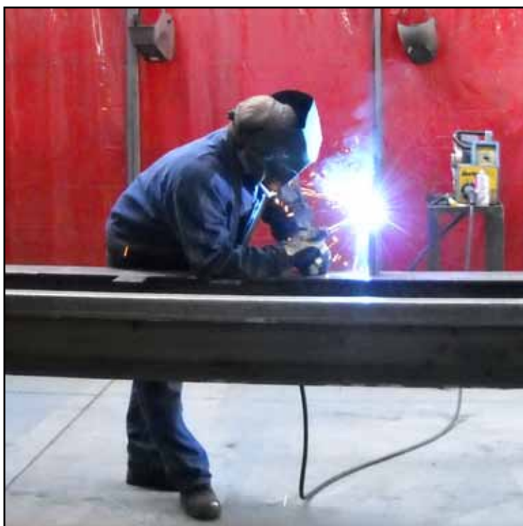
Fabricage in ons atelier Fabrication dans notre atelier