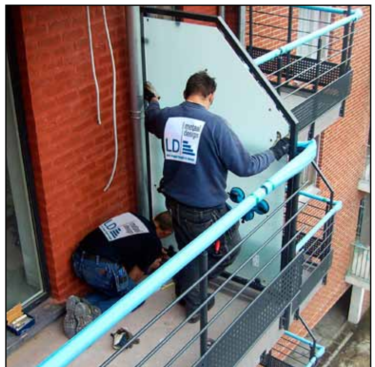
Montage en plaatsing Montage et installation