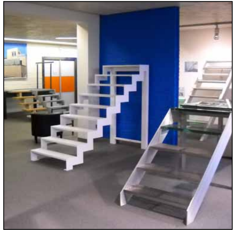
Showroom Salle d'exposition

Présentation LD Metaal design visite salle d'exposition / analyse projet