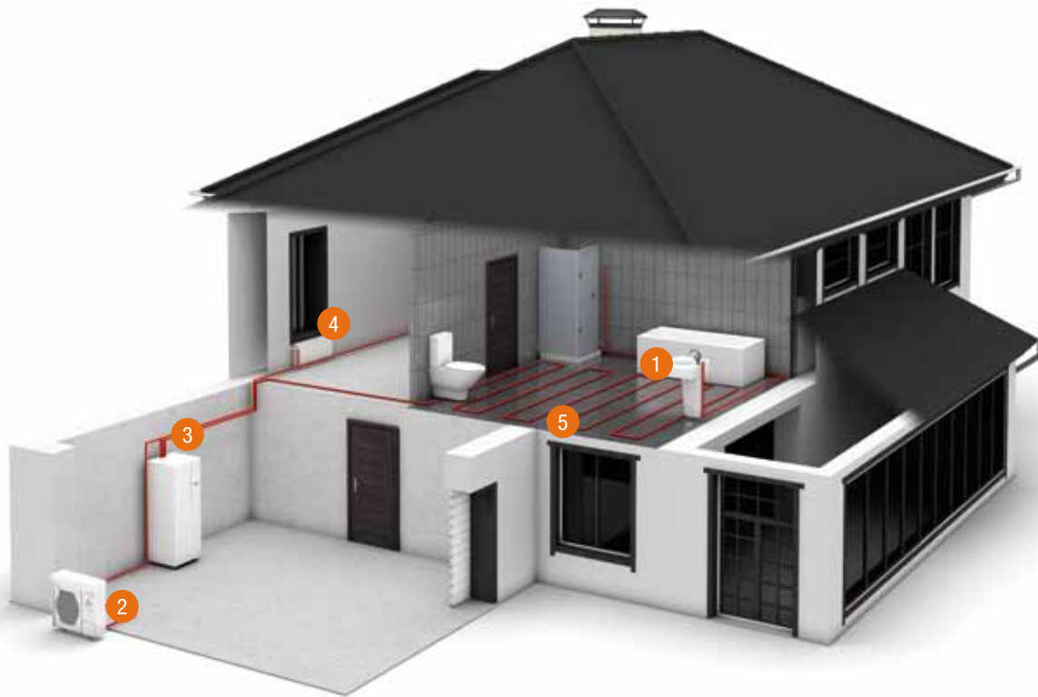
1 Sanitair warm water, 2 Buitenunit warmtepomp, 3 Ecodan boiler of voorraadvat, 4 Radiator, 5 Vloerverwarming